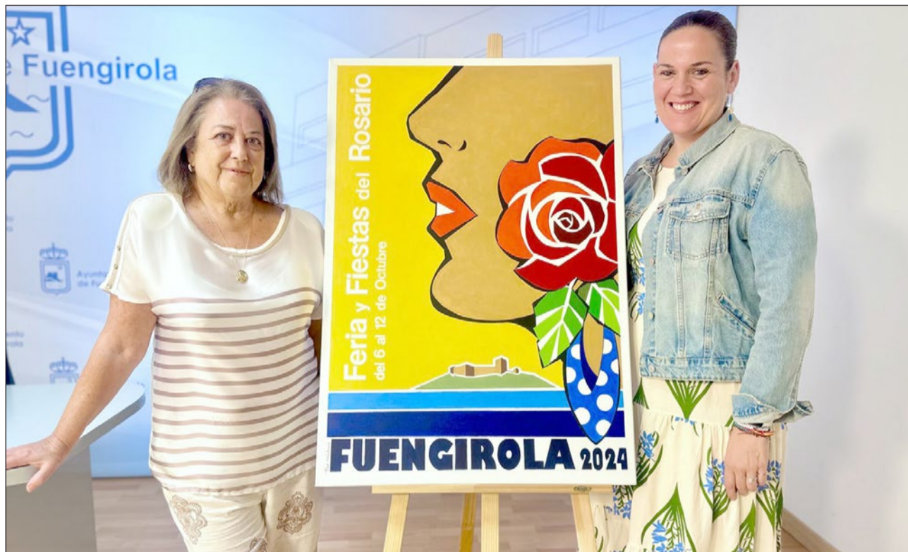
EL CARTEL ANUNCIADOR ES OBRA DE LA ARTISTA PILAR CÁRDENAS