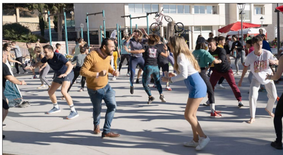
Open Master de Skate.