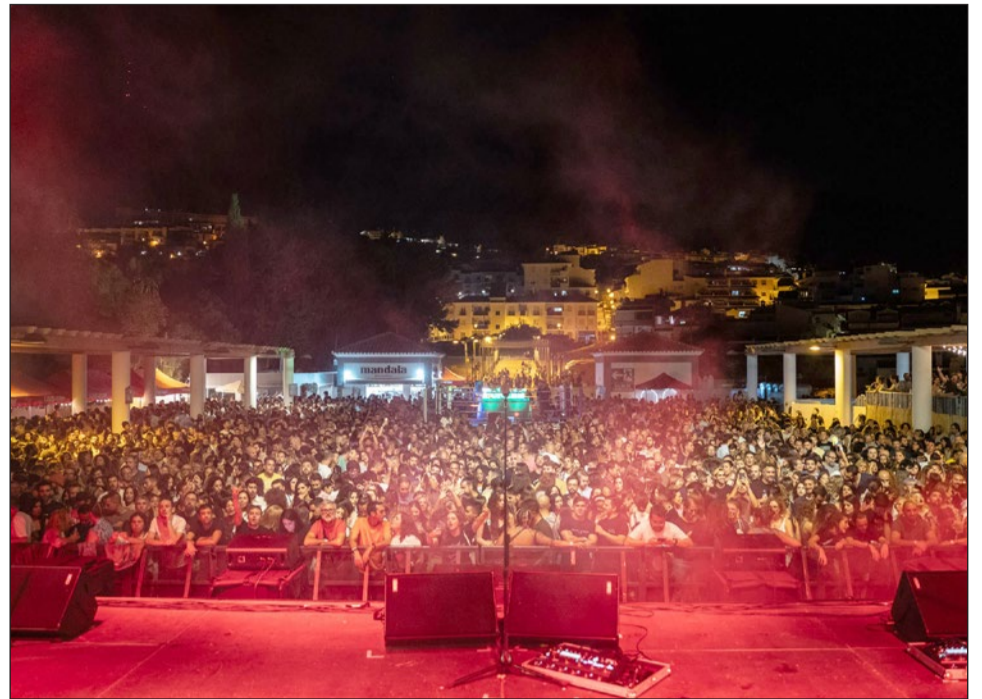
Imagen de la pasada edición del Benalfest.

La Habitación Roja preside el cartel de Benalfest junto al malagueño El Kanka, cantautor que hace una parada dentro de su gira 'Cosas de los vivientes'. Junto a ellos estarán también Varry Brava, Sexy Zebras, Comandante Twin y el granadino Arco. Tras el gran anuncio de La Habitación Roja, el festival avanzó también nuevas incorporaciones: Andrew,