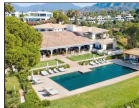
Mansión en Las Lomas.

En tercer lugar aparece una mansión en la 'Milla de Oro' de Marbella con el mismo precio que la anterior (29 millones): una residencia con seis lujosos dormitorios, hammam (un baño árabe), gimnasio, bodega y sala de juegos, entre otras comodidades.