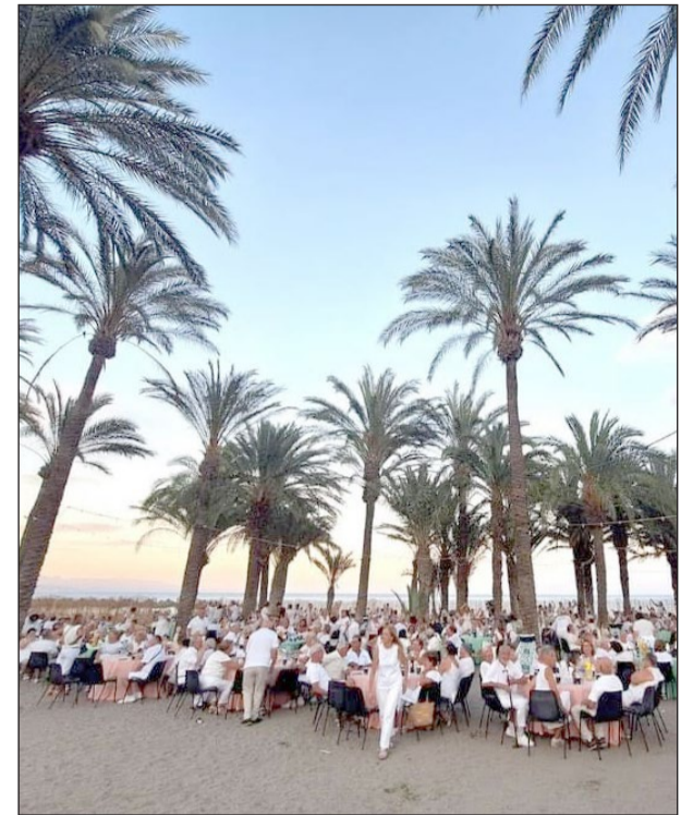
BARBACOA DE MAYORES | Los mayores del municipio volvieron a ser los protagonistas de una velada entrañable y alegre, con motivo de la celebración de la barbacoa organizada por la Delegación municipal que resultó un rotundo éxito, sobre todo por el estupendo ambiente y animación que rodeó el evento.