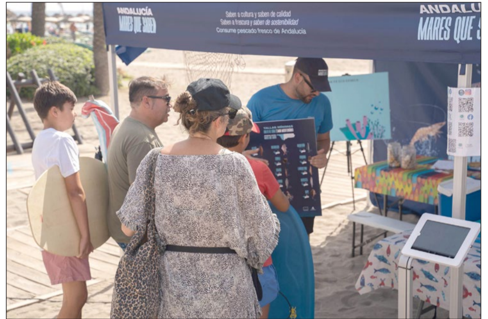
La campaña arrancó a primeros de este mes en el Puerto Deportivo

La campaña se pone en marcha no solo a través de su difusión en medios de comunicación, soportes físicos y digitales y redes sociales; también se acerca a las playas del litoral para que la ciudadanía conozca la singularidad de nuestros mares. Esta campaña contempla 200 actuaciones en las cinco provincias