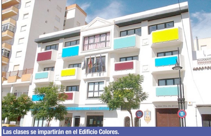
Las clases se impartirán en el Edificio Colores.

En el caso del taller de Teatro, las clases se impartirán de octubre a junio, los martes y jueves por la tarde. En este caso, el taller se divide en cuatro turnos. El primero de ellos está dirigido a niños nacidos entre 2015 y 2018 y se imparte (los martes y jueves) de 16.30 a 17.30 horas; el segundo es para niños nacidos entre 2011 y 2014 y se desarrolla de 17.30 a 18.30 horas; el tercero, que se ofrece de 18.30 a 19.30 horas, está destinado a alumnos nacidos entre 2007 y 2010; y el cuarto turno, que se desa-