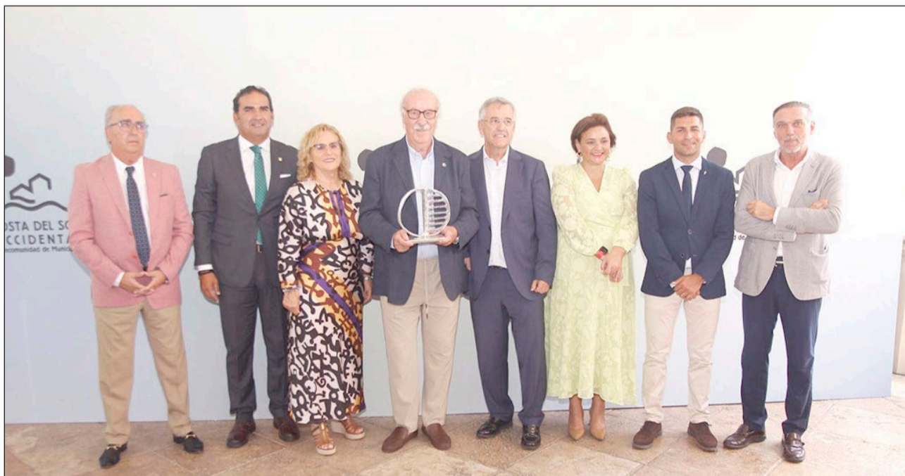
El presidente de la Mancomunidad de Municipios y alcaldes de la Costa del Sol junto al exseleccionador nacional de fútbol.

El 112 detalló que según los alertantes, un vehículo circulaba en sentido contrario y habría provocado el accidente. De inmediato dieron aviso a la Guardia Civil de Tráfico, a mantenimiento de carreteras y a sanitarios del 061, que trasladaron a una persona de 45 años a un centro de salud".