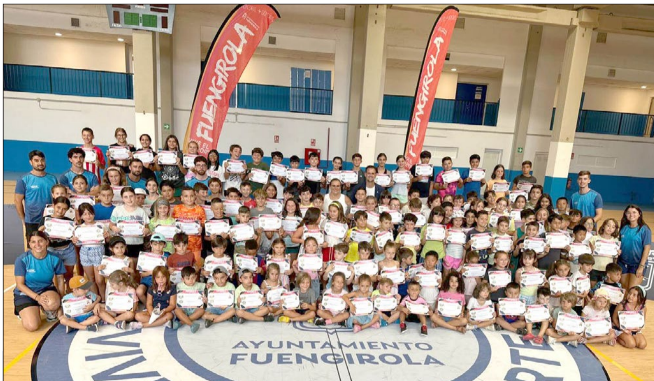
Imagen de familia de los alumnos que han participado en el Campus de Verano en el complejo deportivo Elola.

El Área de Deportes ha ofertado este verano 1.335 plazas en las diferentes instalaciones municipales