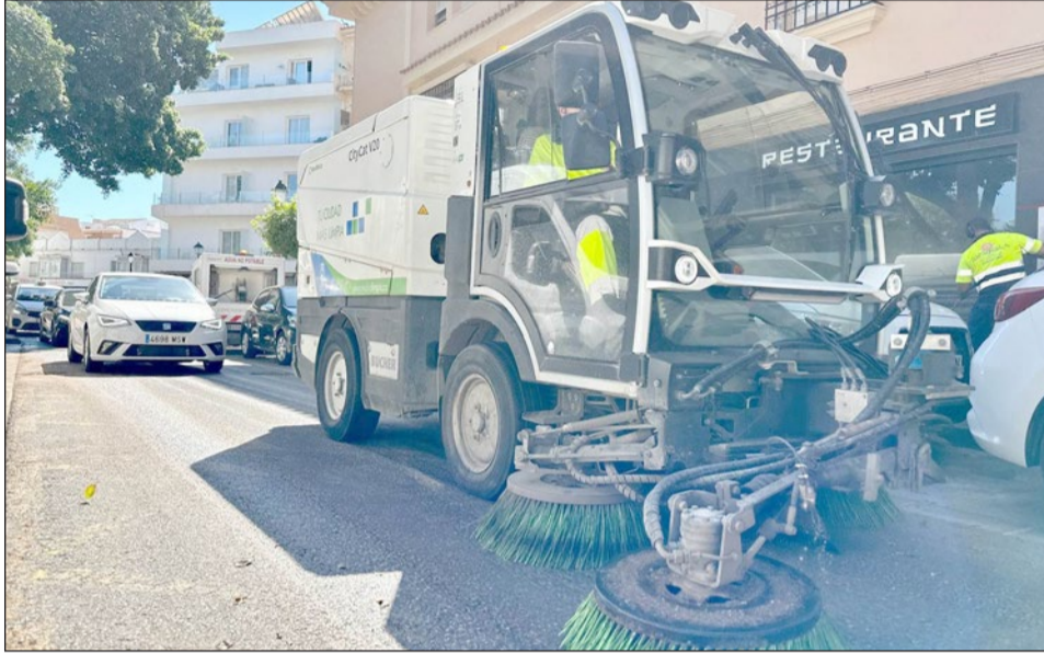
Una máquina barredora actuando en una calle de Fuengirola.

“Fuengirola siempre ha destacado por ser una ciudad limpia y ordenada. Así lo acreditan diferentes premios y reconocimientos en la materia, como la Escoba de Platino o la Bandera Verde de Ecovidrio, entre otros. Y eso ocurre porque llevamos muchos años haciendo hincapié en este servicio esencial para el bienestar de nuestros vecinos y para la imagen