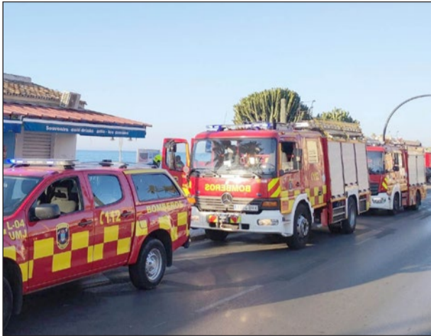
Dotaciones de Bomberos en el Paseo Marítimo.

El día de ayer estuvo marcado por el terral y las altas temperaturas. Situación que llevó al INFOCA a recordar el nivel de riesgo extremo de incendios forestales. A pesar del aviso, los Bomberos de Benalmádena tuvieron que intervenir para sofocar las llamas que se habían desatado en una zona de arbustos del municipio.