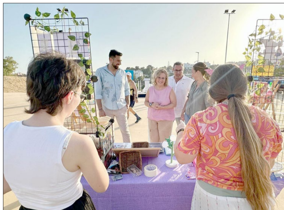
La alcaldesa visita uno de los stands instalados con motivo del Día Internacional de la Juventud.

contáis con unas instalaciones municipales donde poder realizar múltiples actividades y plantear vuestros proyectos. Hablo del edificio Colores, principalmente, pero también tenéis a vuestra disposición equipamientos deportivos como el Elola, el Santa Fe de Los Boliches, la piscina María Peláez o los pro-