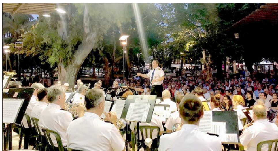
La Banda Municipal de Música ofrecerá hoy un nuevo concierto.

“Este martes vamos a tener otro concierto de la Banda Municipal en el parque de España, con un