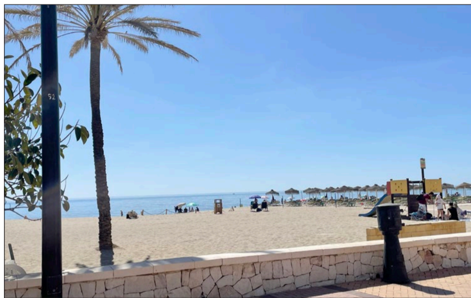
Esta actividad se desarrollará hoy martes en la playa de Las Gaviotas, frente al Hotel Ilunion.

Las acciones que se llevan a cabo persiguen con-