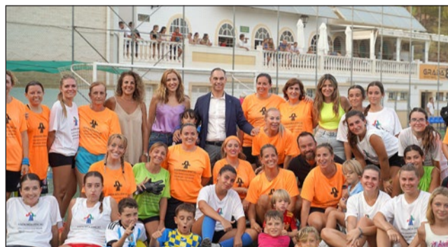
Partido Solteras vs. Casadas 2023.

El Polideportivo Ramón Rico acogerá varias competiciones deportivas en estos días. El 12 de agosto será el Torneo de Fútbol Sala Senior (18.00 horas) y el partido en homenaje a Ramón Rico (19.30 horas). El 13 de agosto continuará el Torneo de Fútbol Sala y a partir de las 20.00 horas se celebrará el Partido de Solteras contra Casadas, seguido del Partido de Solteros contra Casados.