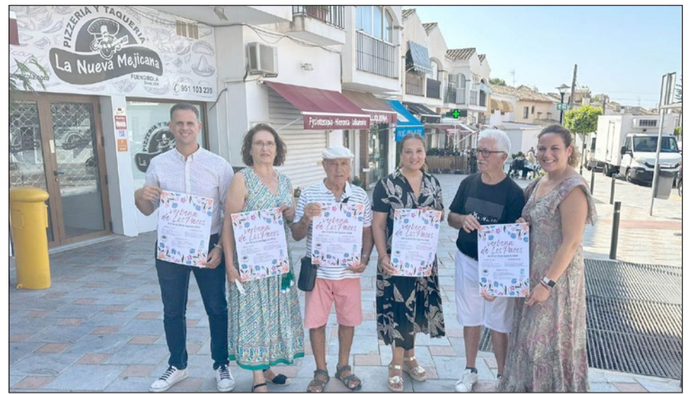
Los ediles fuengiroleños junto a miembros de la Asociación “Árbol” de Los Pacos.

“Cada mes de agosto el barrio de Los Pacos se engalana más que nunca para celebrar su verbena, que el Ayuntamiento de Fuengirola organiza codo con codo junto a la asociación de veci-