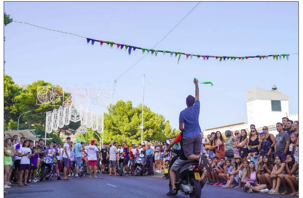
Carrera de Cintas en moto.

tres días de competición. El 16 de agosto será también un día intenso en el Polideportivo: 17.00 horas, Torneo fútbol sala Benjamín-Alevín; 18.00 horas, Torneo fútbol sala Infantil-Cadete.; 19.00 horas,