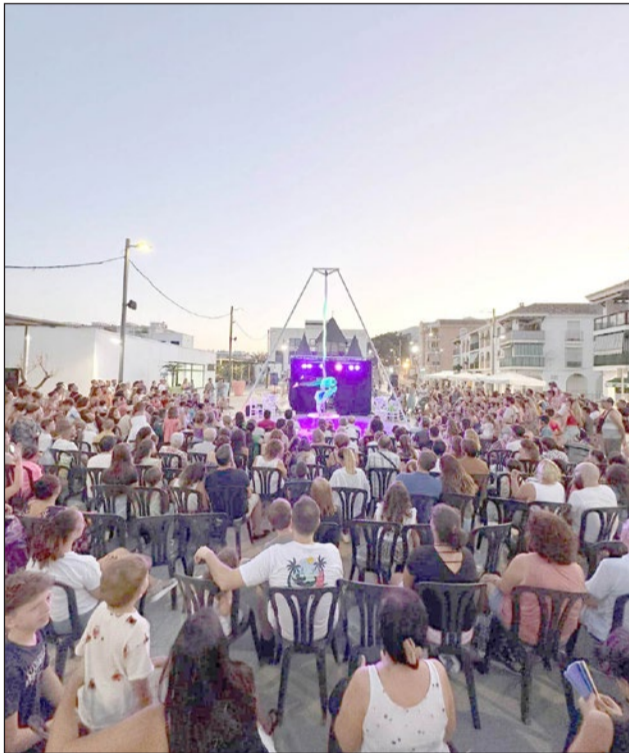
Circo y humor a la fresca con Rolabola en Pueblosol.

El programa 'Cultura en la Calle', una tradicional iniciativa que cada año traslada el mundo del arte al aire libre con multitud de iniciativas variadas como flamenco, cine y espectáculo circense. Con esta nueva edición, la propuesta se consagra como una de las grandes apuestas de la cultura en Benalmádena al aire libre, sumando escenarios en plazas, par-