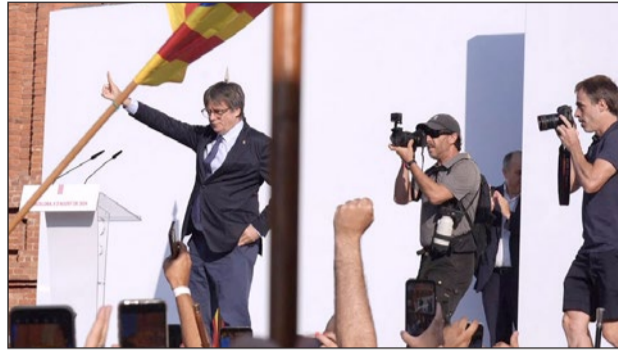
El expresidente catalán, Carles Puigdemont, ayer, en Barcelona.

Sin embargo, logró burlar el dispositivo de seguridad desplegado en las inmediaciones del Parlament, en el que ayer jueves se celebró el pacto para investir a Salvador Illa (PSC) presidente de la Generalitat y al que