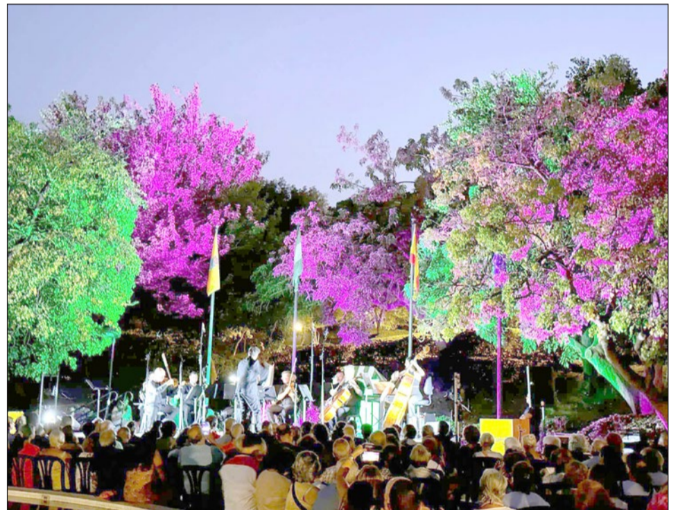
La Orquesta de Cámara de la Sinfónica de Andalucía en el Parque de La Paloma.