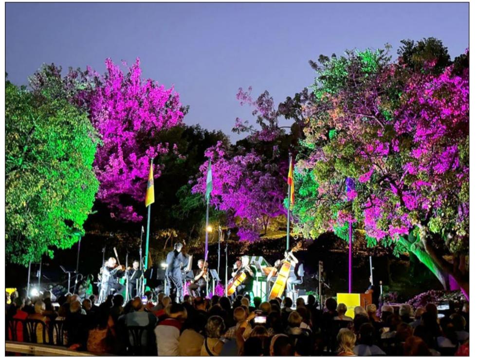
Éxito del concierto de la Orquesta de Cámara de la Sinfónica de Andalucía en el parque de La Paloma.

Las actuaciones y proyecciones de 'Cultura en la Calle' son gratuitas hasta completar afo-