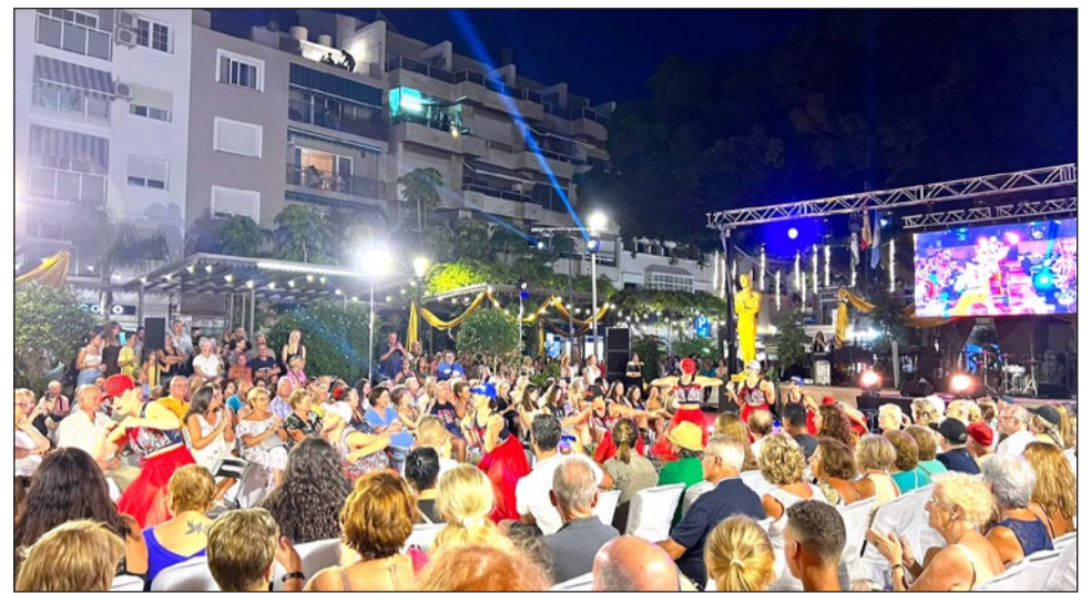
La edición de este año de la Noche Viva tendrá a las artes escénicas como eje central.

La edil recordó que, este año, la Noche Viva se desarrollará en los siguientes espacios públicos: en las plazas de España, Punta Umbría, Reyes Católicos, Constitución, Marqués de Cardeñosa, Hispanidad, Theresa Zabell y Pedro Cuevas, así como el Puerto