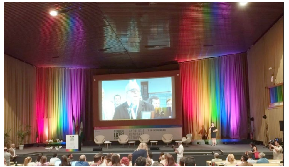
Imagen del congreso celebrado el pasado mes de junio.

Respecto al perfil de la persona inscrita, la mayoría fueron hombres (51%) y también han predominado las personas de entre 25 a 45 años. Además, el 21% proviene del ámbito de la educación, siendo el 98% de nacionalidad española, principalmente, de Andalucía (91%), aunque también se inscribieron personas de otros territorios como Madrid, Cataluña, Cantabria, Castilla y León,