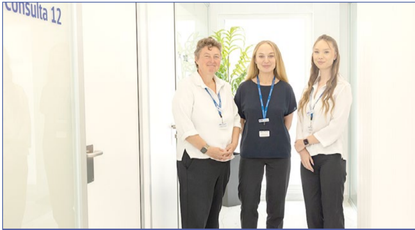
Equipo del departamento de paciente internacional de HM Santa Elena.

médico-quirúrgico, centro integral de oncología, cinco quirófanos, y uno de ellos dedicado a cirugía ambulatoria, sala de hemodinámica y un edificio de 35 consultas. Además, se ha realizado recientemente una amplia renovación de las infraestructuras del Hospital Internacional HM Santa Elena, único hospital privado con el que cuenta el municipio de Torremolinos. La inversión realizada en este centro ha permitido remodelar la zona de consultas y de Radiología, entre otras áreas. Además, se ha creado empleo con la contratación de nuevos profesionales sanitarios y se ha invertido en la adquisición de tecnología de vanguardia. “Las especialidades más demandadas por parte del paciente internacional que acude a nuestro hospital son Traumatología, Cardiología, Cirugía General, Oftalmología,