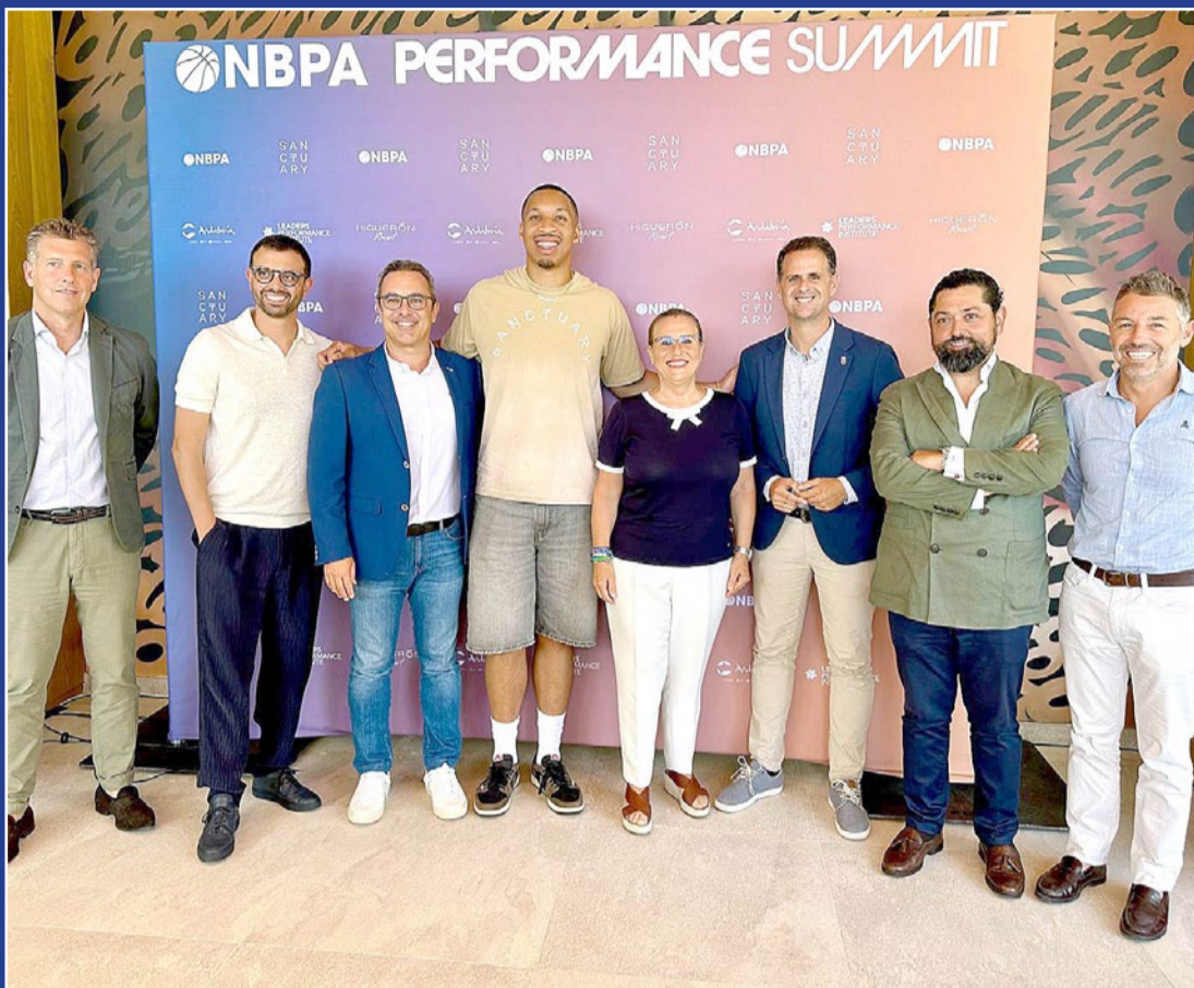
La alcaldesa, junto a ediles, responsables de la Junta de Andalucía y la Diputación y el jugador de Charlotte Hornets, Grant Williams.