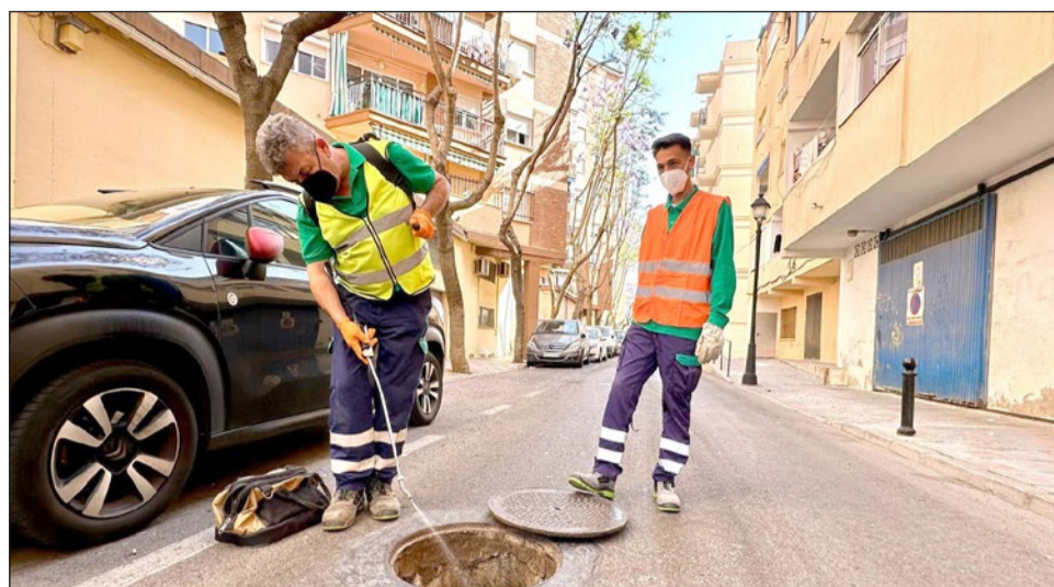
Dos operarios realizan tareas de desinsectación.

red de saneamiento munici- pal. Por ese motivo, el pasa- do mes de mayo iniciamos la campaña de desinsecta- ción de todo el subsuelo de Fuenjirola, la cual ha reco- rrido todas las calles de la ciudad dos veces, pues dos semanas después de la pri-