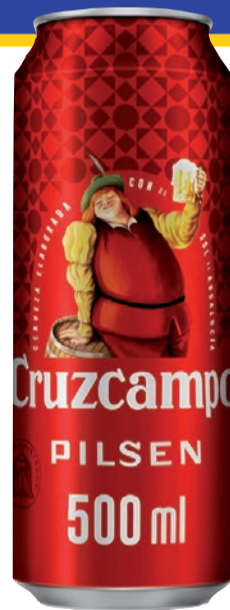
Cerveza CRUZCAMPO lata 50 cl (1,34 €/L)

Oferta válida del 1 al 13 de agosto de 2024