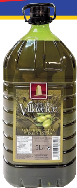
Aceite de oliva virgen extra Torre de Villaverde 5 L (7,99 €/L)