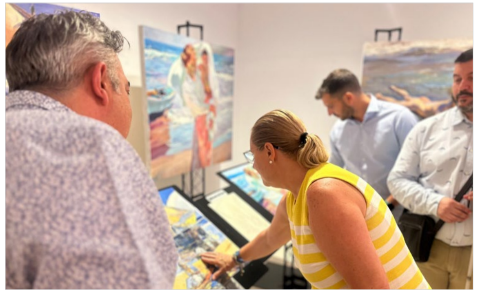
La alcaldesa, Ana Mula, interactúa con una de las obras expuestas.