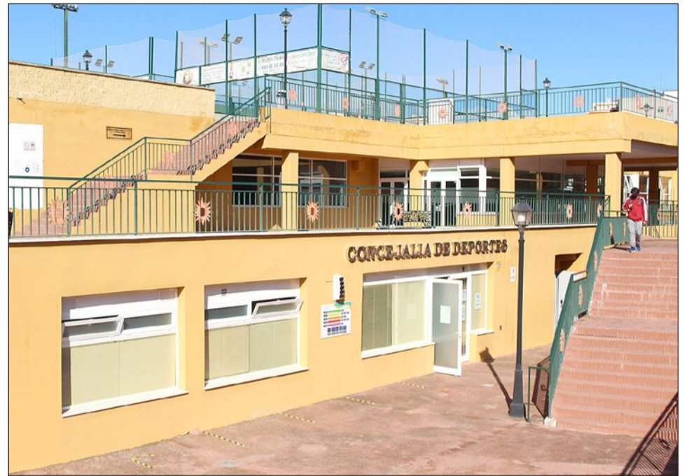
Las oficinas de la Concejalía de Deportes están situadas en el Complejo Elo-la –entrada por la calle Miguel Bueno–.

Al margen de estas actividades han quedado las clases de gestión directa, que son las que se imparten en la piscina María Peláez. Concretamente: gimnasia combinada, natación para la tercera edad, pilates, boditonic, natación para pequeños y escuela de espalda.