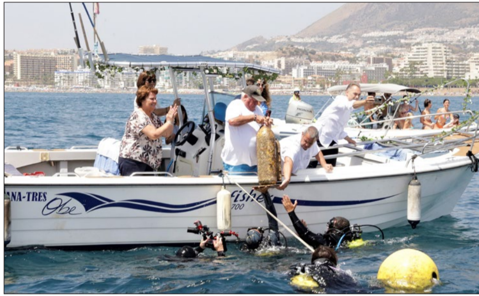
Imágenes de la Bajada de la Virgen y Emersión de la Chiquita de 2023.