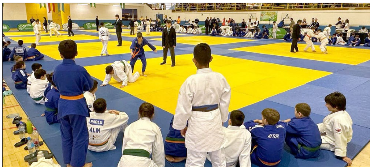
Imagen de la Copa Cadete Europea de Judo celebrada en las instalaciones del pabellón Juan Gómez "Juanito".