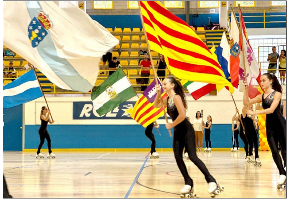
Imagen del Campeonato de España de Patinaje celebrado en Fuengirola.

hincapié en nuevas pruebas que se han puesto en marcha durante el citado periodo. Concretamente, la Carrera de Orientación –con 1.000 inscritos–, la Carrera Solidaria de la Policía Nacional –otros 1.000 corredores–, el Campeonato de España de Minibasket