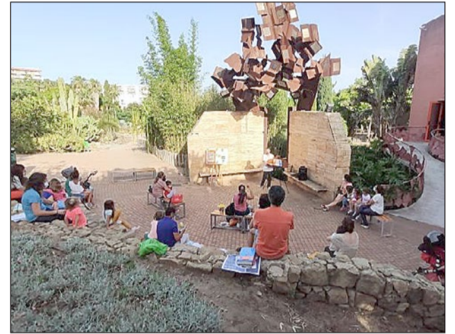
Imagen de una sesión anterior de Tardes de biblioteca.