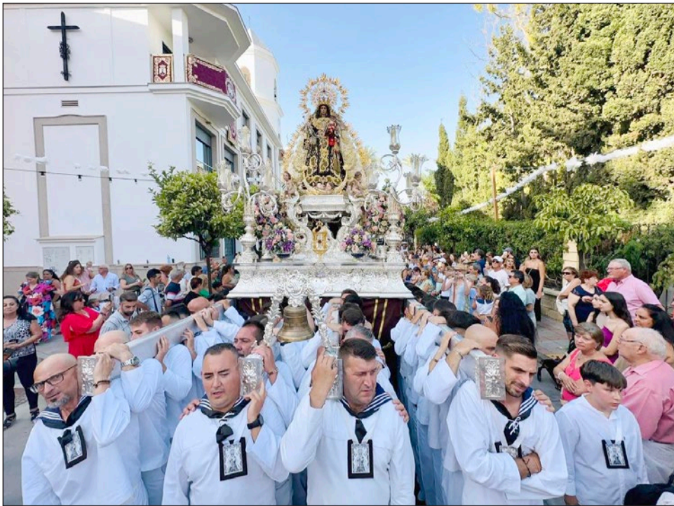
La Virgen del Carmen iniciando su recorrido procesional desde la parroquia del Parque.