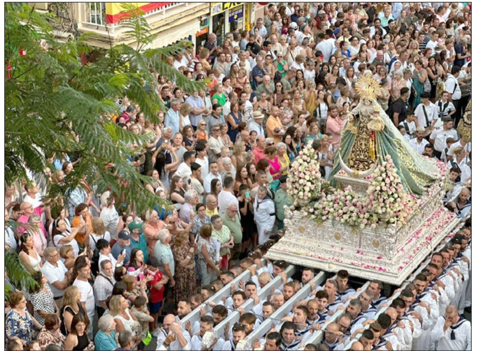
Los Boliches vivió el pasado martes su día grande coincidiendo con la festividad de la Virgen del Carmen.