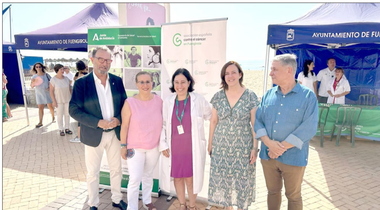
La alcaldesa, el delegado de Salud de la Junta y el presidente provincial de la AECC visitaron las carpas situadas en la playa de Los Boliches.