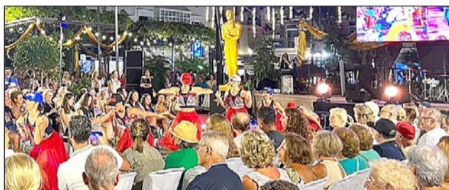
La edición de este año de la Noche Viva se celebrará el 3 de agosto.

“La programación de la Noche Viva, que este año tendrá como temática las artes escénicas, incluye todo tipo de actividades que se desarrollan en las plazas, pero hay que tener muy en cuenta también aquellos servicios que realizamos y