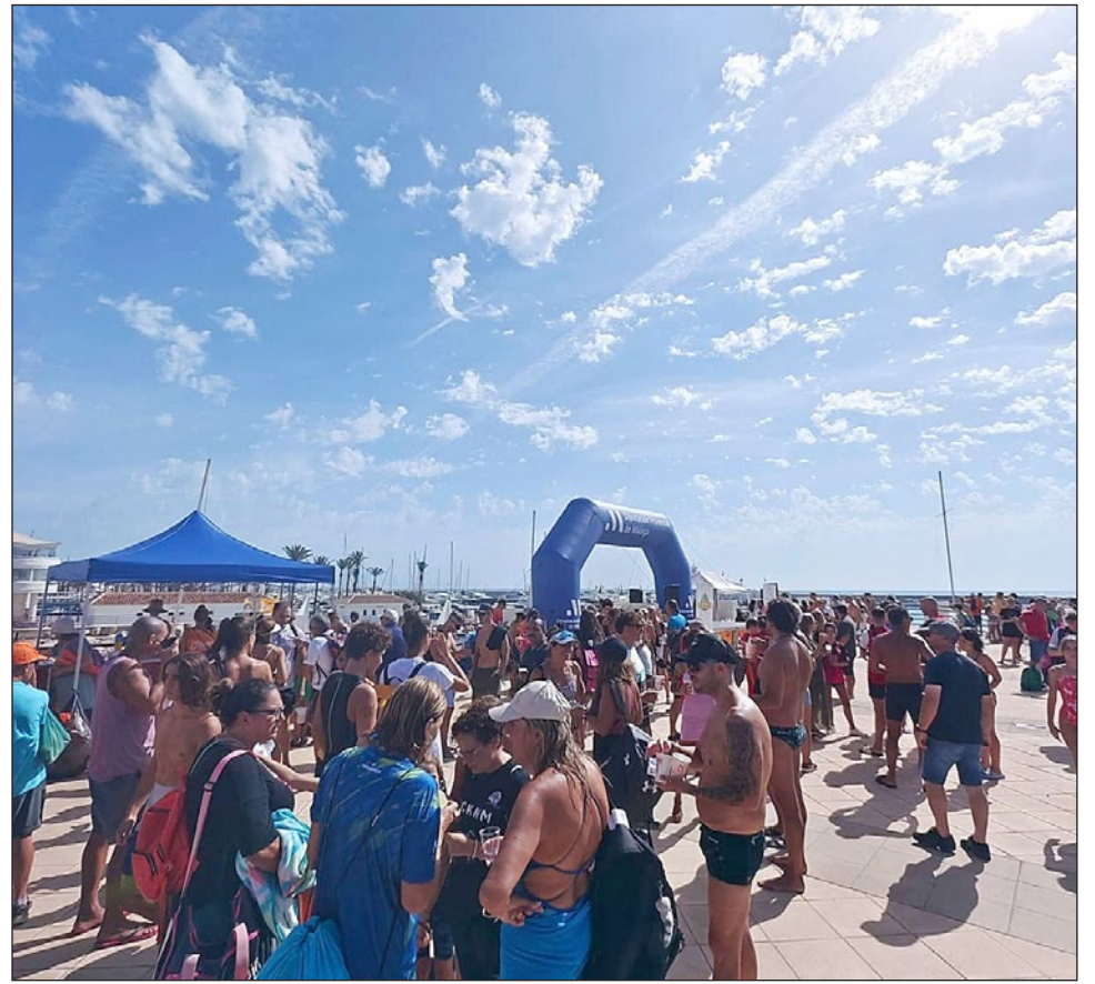
Imagen de la Travesía a Nado de 2023.

Las inscripciones ya están abiertas y se pueden realizar online en la web www.dorsalchip.es hasta el 8 de septiembre, estando limitadas a 300 participantes.