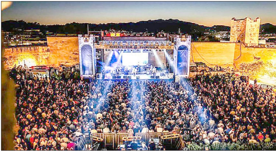
ÉXITO DE LA TERCERA EDICIÓN DE LOCOS POR LA MÚSICA