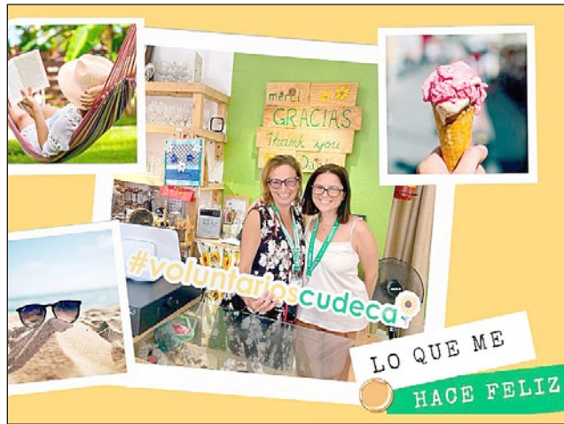
El lema de esta campaña es "Lo que me hace feliz".

una organización sin ánimo de lucro que ofrece atención médica profesional a personas con cáncer y otras enfermedades avanzadas, así como apoyo a sus familias.