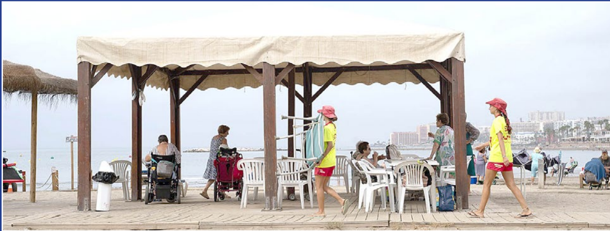
Este verano este programa llegará a cuatro playas del municipio.