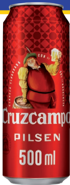
Cerveza CRUZCAMPO lata 50 cl, (1,38 €/L)