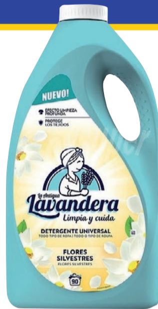
Detergente líquido La Lavandera flor de cerezo o silvestre 90 dosis (0,07 €/ dosis)

Oferta válida del 1 al 31 de julio de 2024