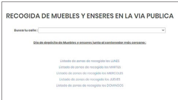
Espacio web de la Delegación de RSU en el que se puede consultar este servicio.

Además, el edil ha recordado que las sanciones pueden alcanzar los 751 euros, "por lo que es importante que la ciudadanía sea consciente de la importancia de colaborar