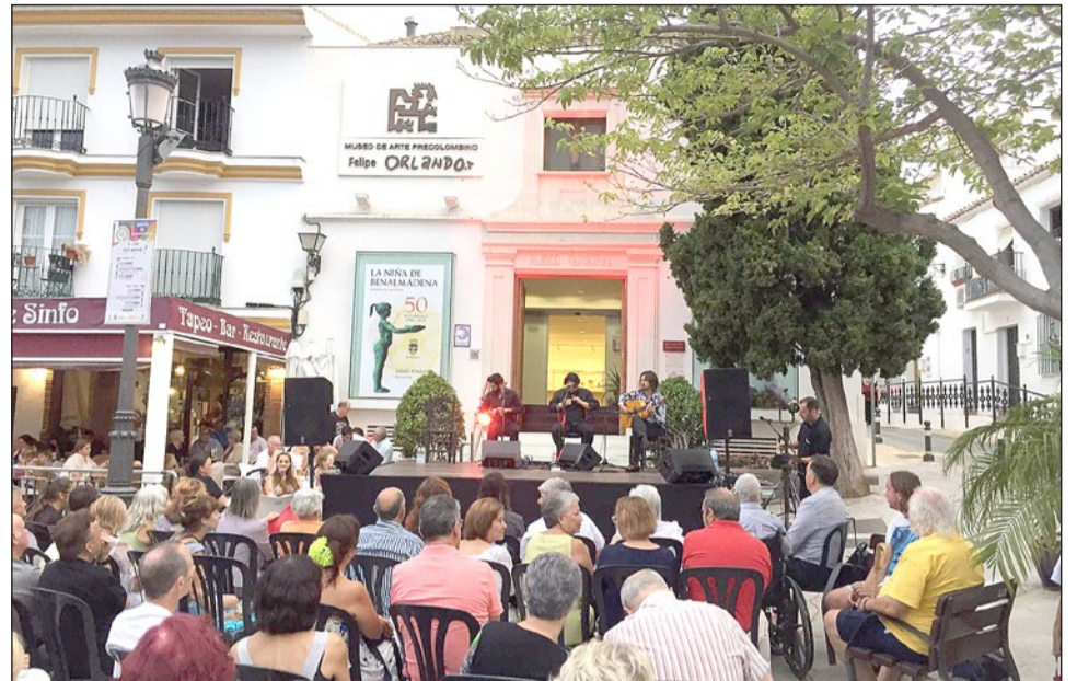
Imágenes de una edición anterior de Cultura en la Calle.

La programación de agosto comenzará el mismo día 1, en la plaza de Pueblosol, con un nuevo espectáculo de circo para toda la familia, que se repetirá el día 8. El cuadro flamenco de Juan Requena actuará el día 2 en el Castillo Bil-Bil. La noche del martes, día 6, será de cine en la playa de Malapesquera con "Una familia de superhéroes". Y el ciclo llegará a su fin el 9 de agosto con Andrés Cansino que ofrecerá un concierto en el Paseo de Generalife.