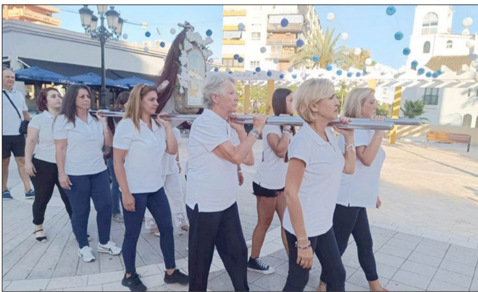
Momento del encuentro de la Chiquita con la Virgen del Carmen.