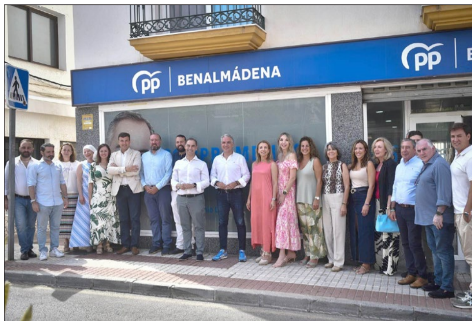
Reunión del vicesecretario de Coordinación Autonómica y Local del PP, Elías Bendodo, con diputados y senadores en Benalmádena.

El dirigente subrayó que el Partido Popular "siempre antepone el interés general por encima del interés del partido", y puso como ejemplo a Benalmádena, donde en las últimas elecciones municipales los ciu-