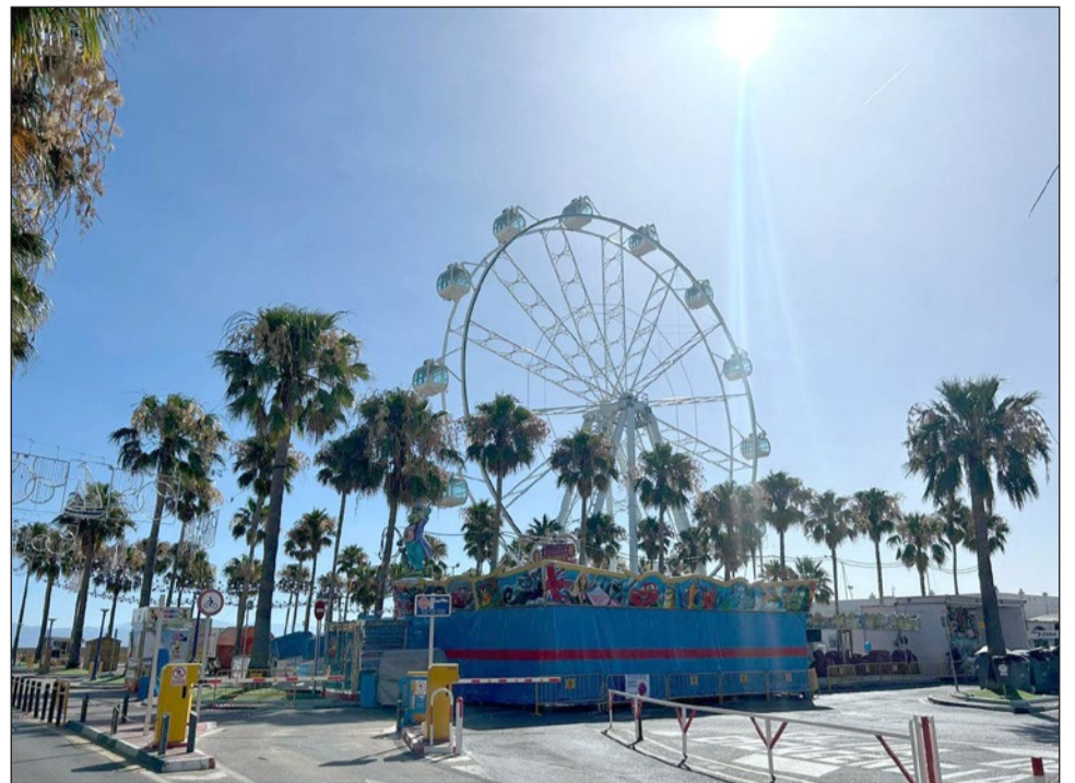
Este año la veladilla se realizará en la explanada de la noria del Puerto

DePol cerrará el ciclo de actuaciones con un concierto previsto a partir de las 12 de la noche.