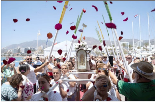
Traslado de La Chiquita.

Benalmádena se prepara para vivir con intensidad su Veladilla del Carmen 2024, que este año estará llena de novedades en la apuesta decidida del nuevo equipo de gobierno de Juan Antonio Lara por potenciar todas las actividades y tradiciones en la Costa, añadiendo un día más a la fiesta y estrenando nuevo emplazamiento: frente a la noria en el Puerto Deportivo.