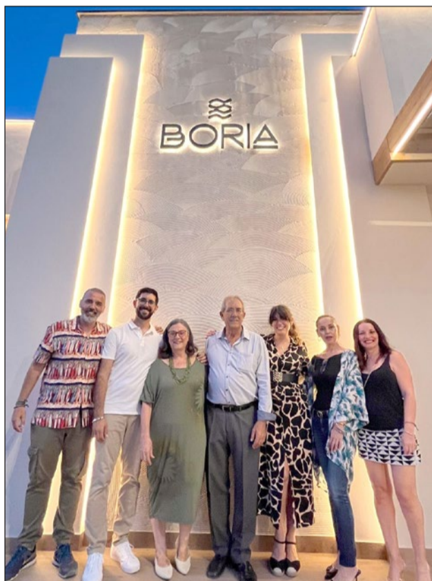
"Casa Franco" y que siguen apreciando sus muchos clientes habituales. Merced a ese talante,

personas de todo el mundo regresan año tras año a este rincón de Torremolinos, trayendo a sus hijos, e incluso nietos, hasta el desde ahora "Boria" para seguir disfrutando del "sabor" más apreciado de nuestra tierra.