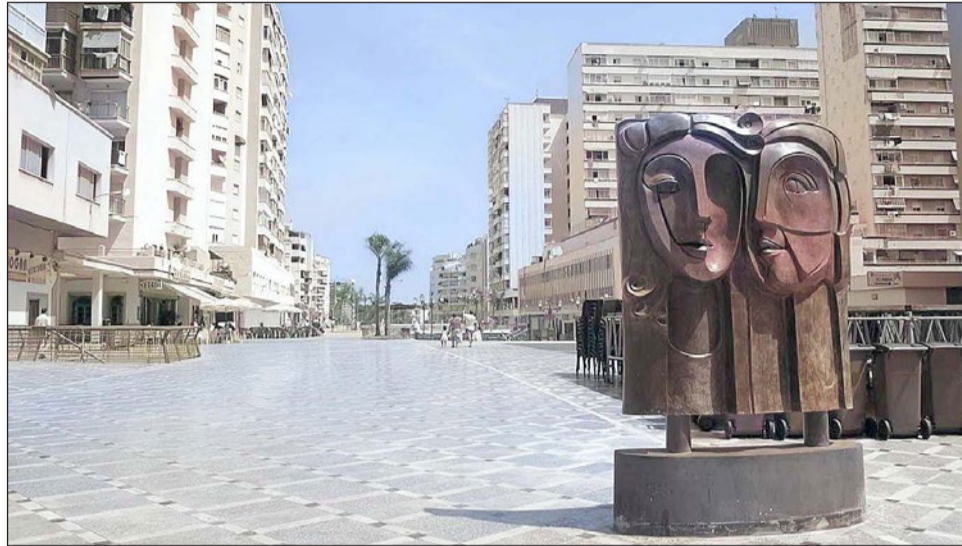
El proyecto supondrá una profunda transformación estética de la hoy desangelada Plaza Adolfo Suárez.

En definitiva, la ejecución de este proyecto supondrá el cumplimiento de un compromiso adquirido en su momento, concretamente en 2022, por la entonces candidata a la Alcaldía del Partido Popular (PP), Mar-