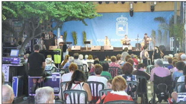
Imagen de una edición anterior de la Verbena de El Boquetillo.