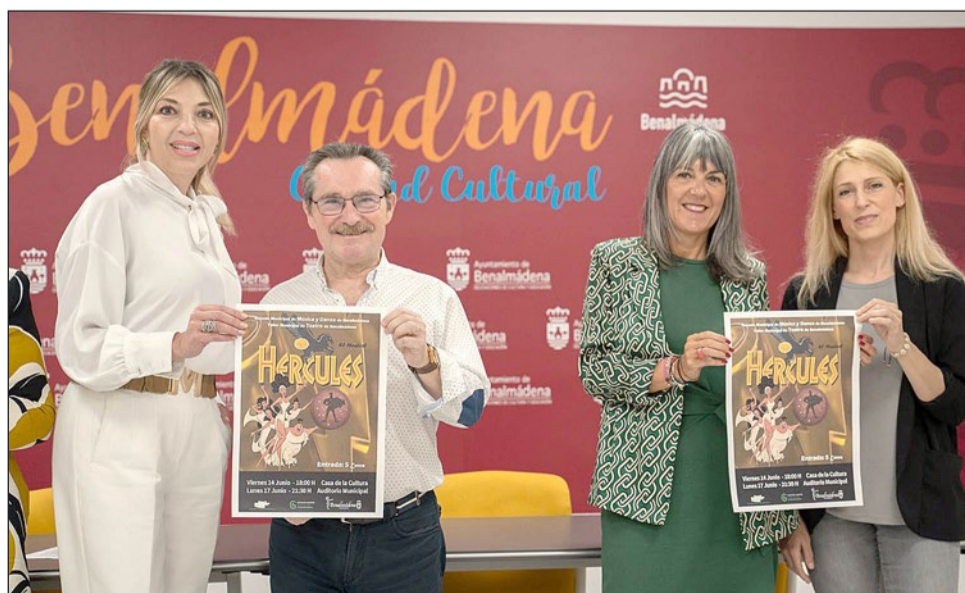
"Hércules: El Musical" será una de las representaciones que se podrá ver gracias al trabajo de las escuelas.

demuestra la gran calidad de sus trabajos y su enorme dedicación; además de invitar a todos los vecinos y visitantes a participar y disfrutar de este atractivo programa de actividades y a que conozcan la variada y completa oferta de cursos y talleres que cada año pone en marcha la Delegación de Educación".