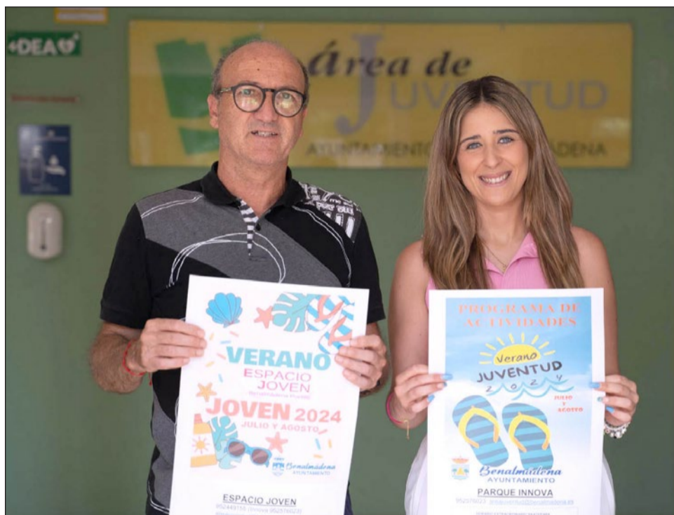
El programa completo se puede consultar en la web del Ayuntamiento de Benalmádena.

Habrà talleres formativos y recreativos como el taller de encuadernación artesanal, de iniciación teatral, de iniciación al idioma y la cultura japonesa y rusa, clases de canto y de ukelele... Tampoco faltarán las actividades físicas y de promoción de la salud con crosstraining, dry surf, Bollywood Dance, Capoeira, Fitness Dance, Gimnasia de piernas, glúteos y abdominales, incluyendo también nuevo flamenco, pilates, rit-