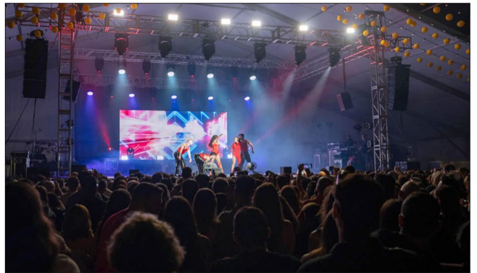
Lleno en la Caseta Municipal el martes para el concierto de Chanel.

Un poquito más, hasta el domingo, se extenderá la Feria de Día de Pueblosol, donde la Asociación Aprende tiene su barra solidaria: "Queremos sumarnos a la fiesta de nuestro patrón con la inclusión por bandera, agradeciendo también la ayuda de empresarios y comerciantes que han participado de algún modo para que podamos estar presentes en este evento", señalaron desde el colectivo.