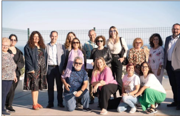
El Vuelo de Las Libélulas inauguró el pasado mayo nueva sede en un acto al que asistió el alcalde de Benalmádena.

fichas huérfanas no tienen dueño, son aquellas que no recogen sus jugadores, que se entregan al Ayuntamiento cada año para que la administración, siguiendo criterios técnicos, otorgue dicha cuantía a proyectos