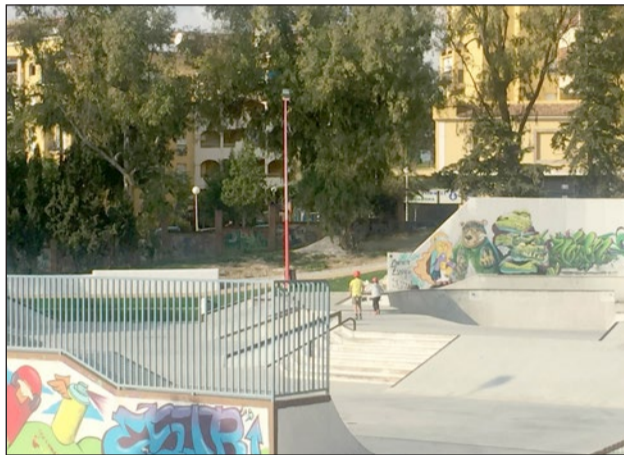
El skatepark acogerá el "Street Contest Arroyo".

El 22 de junio será el turno de las "12 horas" del Club de Tenis de Mesa. Desde las 9.30 hasta las 21.30 horas, el club llevará a cabo la fase de grupos, de entre 6 y 8 jugadores, que tendrá lugar por