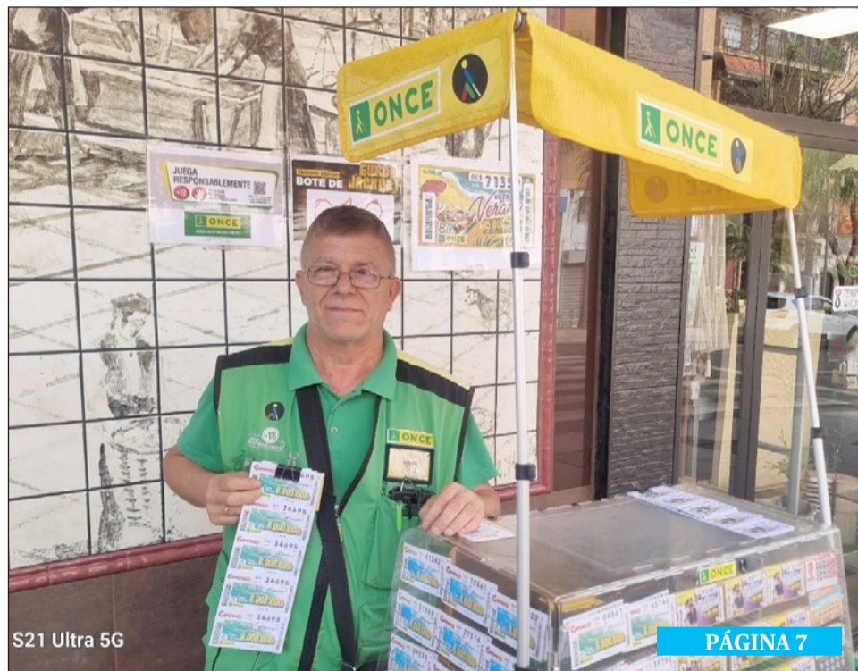
S21 Ultra 5G

Así, este mes se jugarán el Torneo de Bádminton, las "12 Horas" del Club de Tenis de Mesa o los 10 kilómetros en pista. P.5