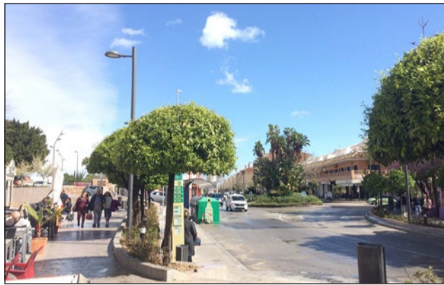
Los cupones premiados se vendieron entre Avenida de la Constitución y García Lorca, en pleno centro de Arroyo de la Miel.

El sorteo del 6 de junio estaba dedicado a la Semana del Medio Ambiente, ayer