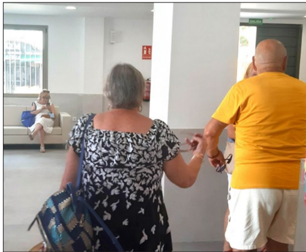
Interior del Centro "Anica Torres".