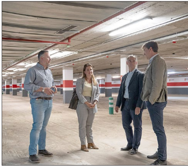
El alcalde visitó las instalaciones el pasado mes de mayo.

Cabe recordar que la apertura de este aparcamiento subterráneo es una apuesta decidida del nuevo equipo de gobierno tras llevar años cerrado, enmarcado en el compromiso de crear nuevas bolsas de aparcamientos por todo el municipio que descongestionan el tráfico al mismo tiempo que mejoran la calidad de vida de vecinos de