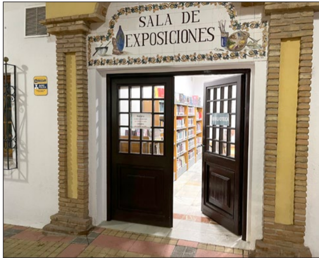
La Casa de la Cultura funciona como biblioteca provisional mientras duren las obras de reforma de la Biblioteca Arroyo de la Miel.

En cuanto a la Biblioteca Pública Arroyo de la Miel presenta 140 nuevos títulos,