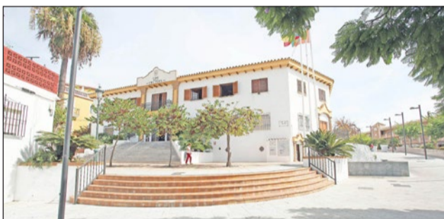
La Casa de la Cultura y el Auditorio acogerán esta representación.

La Casa de la Cultura y el Auditorio Municipal se preparan para vivir la magia del teatro a beneficio de la Asociación Española Contra el Cáncer de Benalmádena (AECC), de la mano de la Escuela Municipal de Música y Danza de Benalmádena y el Taller de Teatro Municipal.