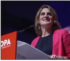
Teresa Ribera, candidata del PSOE. lamento Europeo.

En estos comicios España elige más eurodiputados, ya que el nuevo reparto nos asigna 61 asientos en el Par-