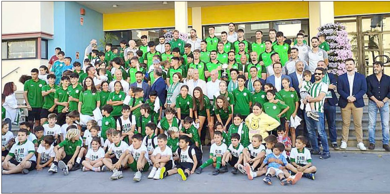
EL JUVENTUD TORREMOLINOS CF, AGASAJADO A LAS PUERTAS DEL AYUNTAMIENTO