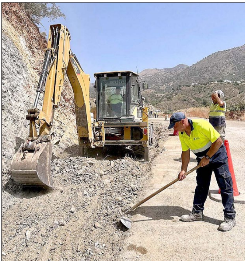
Varios operarios trabajan en las obras de conexión de la zona norte de Torreblanca.