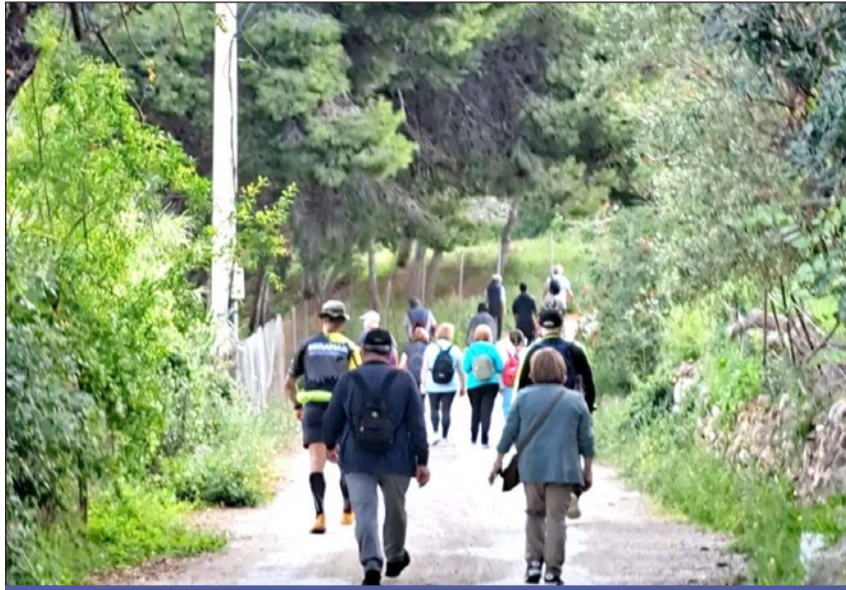
Imagen de una actividad de senderismo celebrada recientemente.

La edil señaló que “recomendamos acudir con ropa y calzado cómodo y durante la ruta ofreceremos un pequeño tentempié compuesto por agua y una pieza