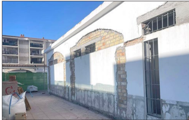
Estado de las obras el pasado mes de febrero.

En cuanto a los trabajos realizados sobre las instalaciones, se ha llevado cabo la modificación de todas las carpinterías y la fachada, aumentando su espesor con un sistema de Aislamiento Térmico Exterior de 8 cm (SATE), que posteriormente se ha aplacado con placas de gres porcelánico, además de